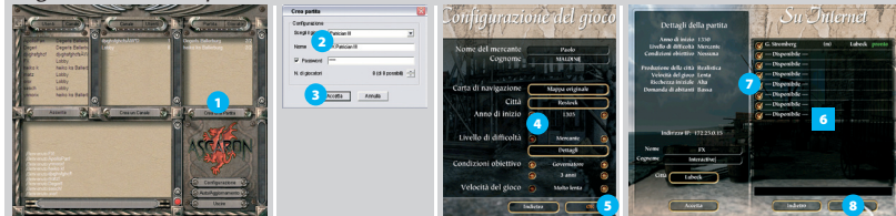
Figura 15-3: Crea una partita