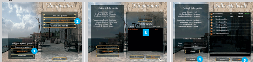
Figura 15-4: Unirsi a una partita