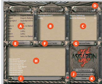
Figura 15-2: Schermata principale

Da questa schermata puoi accedere a tutte le opzioni del server. Quando si apre entri direttamente nel "Canale principale" dove puoi vedere l'elenco dei giocatori connessi e unirti a una partita cliccando sul suo nome. Se vuoi puoi anche accedere ad altri canali o crearne uno privato.